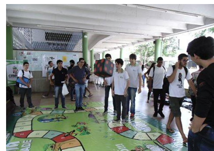
Participação da Comissão Regional de Animais Selvagens e Meio Ambiente do CRMV/PB – CRASMA, no II Salão de Sustentabilidade e Meio Ambiente, que aconteceu no IFPB/ Campus João Pessoa.