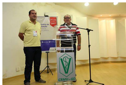
Participação dos Fiscais do CRMV/PB no I Seminário de Fiscalização do Sistema CFMV/CRMVs, realizado em Goiânia-GO.