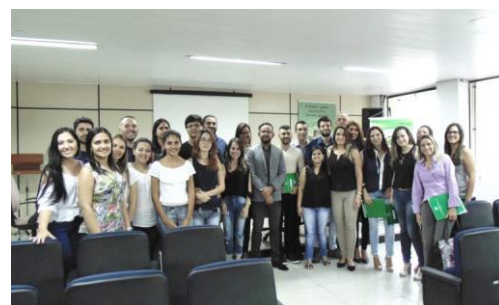
Solenidade de Entrega de Carteiros.