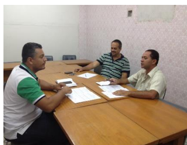
Reunião da Comissão Regional de Zootecnia do CRMV/PB.