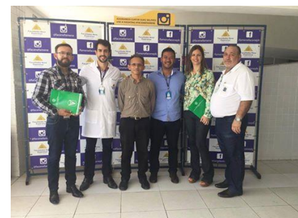
Comissão Regional de Ensino da Medicina Veterinária do CRMV/PB inicia visitas aos cursos de Medicina Veterinária do Estado da Paraíba.

Conselho Regional de Medicina Veterinária da Paraíba – CRMV/PB Praça Pedro Gondim, 127 – Torre – João Pessoa-PB / 58040-360 Telefone: (83) 3222-7980 - crmvpb@crmvpb.org.br Expediente: Segunda à Sexta das 12h às 18h