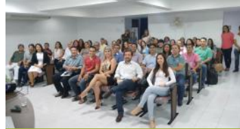
I Curso de Atualização em Saúde Pública com ênfase na atuação do Médico Veterinário no NASF.