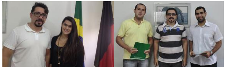
Tomaram posse em 2016 os funcionários aprovados no concurso público do CRMV/PB.