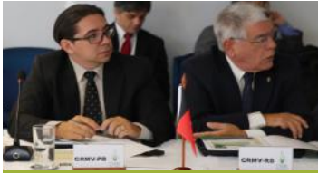
Câmara Nacional de Presidentes do Sistema CFMV/CRMVs, que aconteceu nos dias 18 e 19 de abril em Brasília.