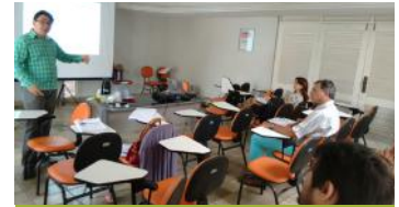
Treinamento sobre Processo Ético com Diretoria e Conselheiros do CRMV/PB.