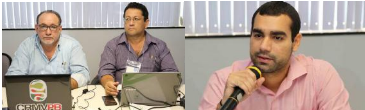
Funcionários do CRMV/PB participaram do II Encontro de Usuários do Sistema de Cadastro (Siscad), que ocorreu entre os dias 22 e 24 de agosto, em Brasília.