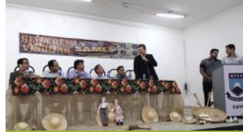
IV Semana Acadêmica de Medicina Veterinária (SAMEV) 21/09/16 UFCG/Patos/PB.